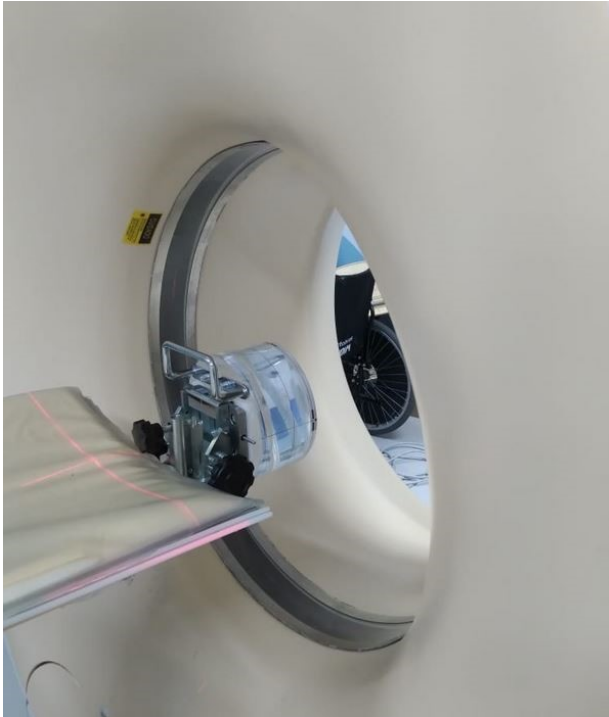
Figura 1- Teste com simulador pediátrico